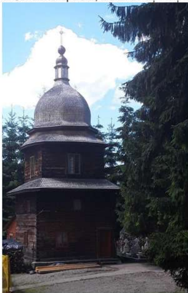
Figura 62 Clopotniță de lemn