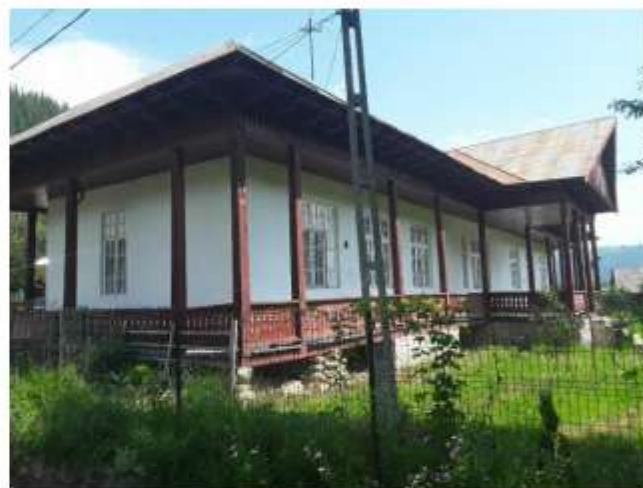
Figura 38 Jandarmerie Ceahlău și Muzeu Satesc