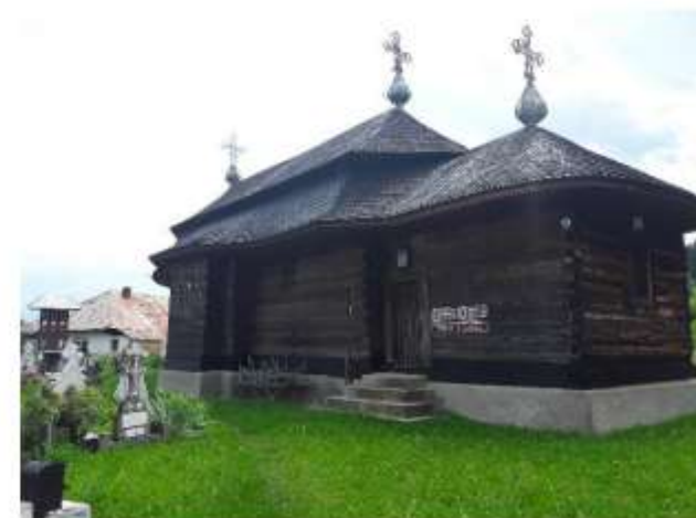
Figura 57 Biserica de lemn "Sf. Ana"