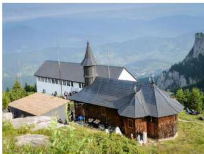
Figura 46 Mănăstirea Ceahlău cu hramurile “Schimbarea la față” și “Sf. Voievod Ștefan cel Mare”