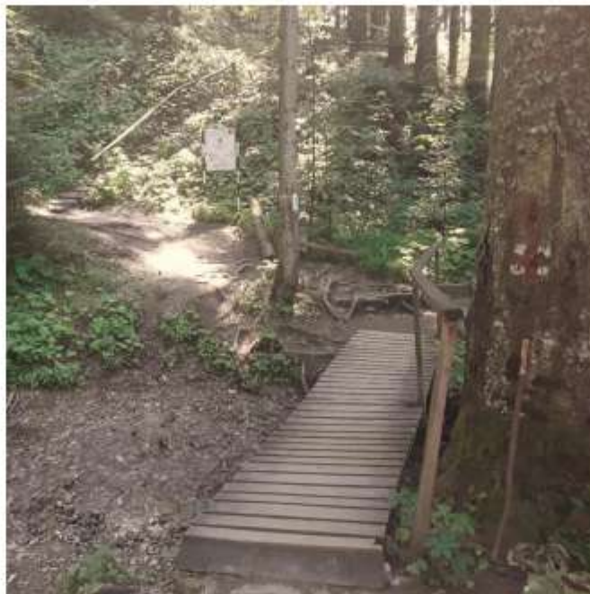
Figura 53 Traseu montan nr.5 – Durau