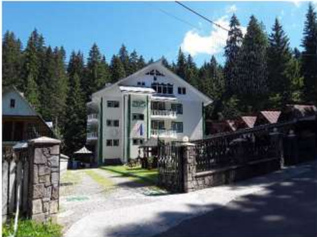
Figura 17 Hotel Cascada – 46 locuri de cazare