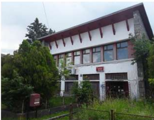
Figura 31 Ghișeu Poștal