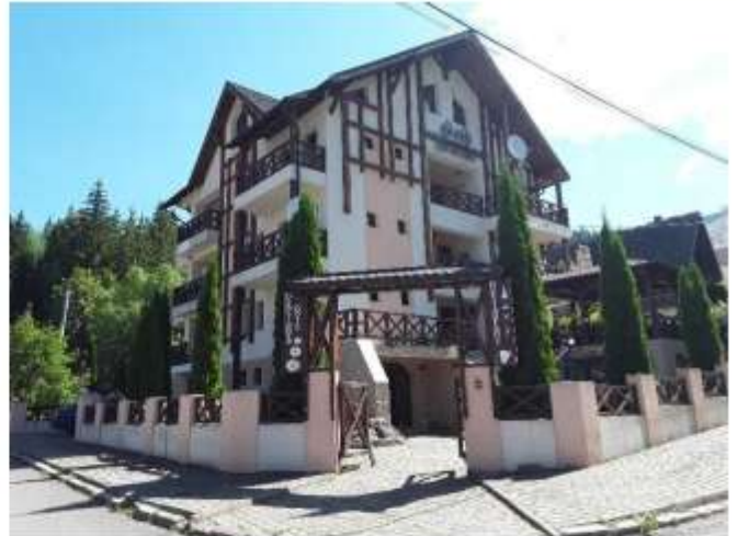
Figura 18 Pensiunea Gold – 24 locuri de cazare