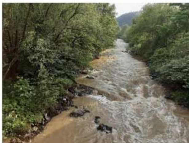
Figura 6 Râul Bistricioara