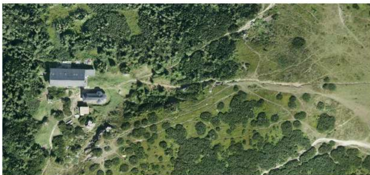
Figura 54 Imagine aeriana Manastirea Ceahlău – Masivul Ceahlău

Așadar, se poate afirma faptul că în comuna Ceahlău există posibilități de dezvoltare și modernizare a turismului prin diversificarea și îmbunătățirea ofertei actuale, punându-se accent pe valorificarea resurselor naturale existente. Dacă la toate cele precizate anterior se adaugă și o activitate intensă de promovare, se poate ca în viitor să se atingă ritmuri superioare ale sosirilor și încasărilor din turism, generând dezvoltarea sectorului turistic.