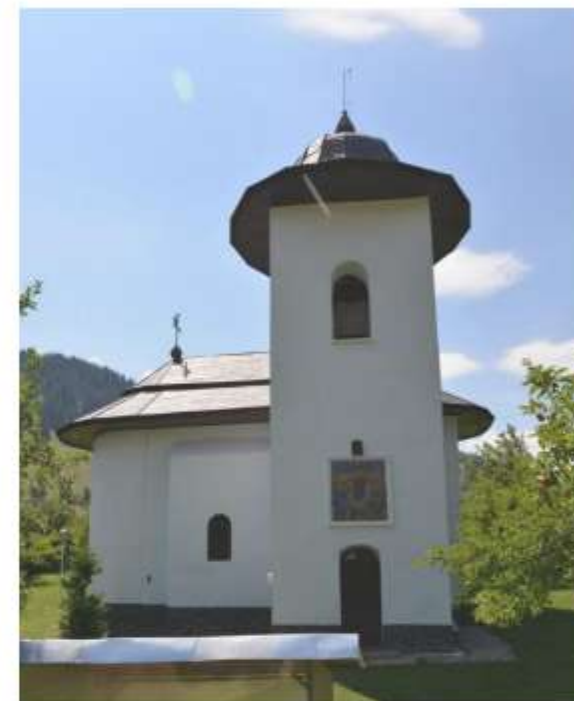
Figura 65 Biserica "Pogorârea Sf. Duh"

Ajuns proprietar al moșiei Hangu, marele vistiernic Toderașcu Cantacuzino (1635-1686) a ridicat un turn circular cu scop de locuință în colțul de nord-est al zidului de incintă. În zidul interior al turnului de colț din dreapta intrării a fost încastrată următoarea pisanie: „Cu voia Tatălui și cu îngăduirea Fiului și cu săvârșirea Sfântului Duh, acesta turn și această portiță l-am zidit eu Toderașcu, marele vistiernic i cneaghina ego Alexandra, în zilele binecinstitorului și de Hristos iubitor Io Antonie Ruset voevoda 7184 (1676) mșta iulie 15 zile”. În afară de acel turn a mai fost ridicat în colțul sud-estic un al doilea turn, tot circular, dar de proporții mai reduse.