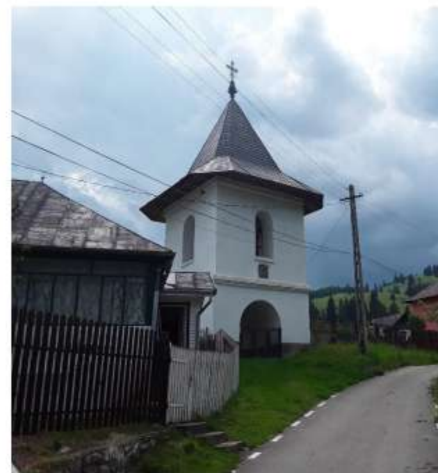
Figura 56 Turn Clopotniță

Biserica „Sf. Ana” din Ceahlău se numără printre puținele biserici de lemn din Moldova care a avut pictură interioară. Aceasta s-a realizat direct pe scândura ce căptușește pronaosul, iar în altar pereții au fost acoperiți de o pânză, peste care s-a aplicat pictura. Din păcate, întreaga zugrăveală se află într-o proastă stare de conservare, puținele fragmente care se mai văd pe alocuri făcând imposibilă orice judecată de valoare asupra acesteia.