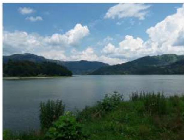
Figura 4 Lacul Izvorul Muntelui