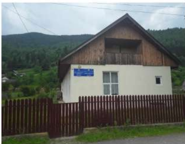
Figura 37 Școală și grădiniță Bistricioara