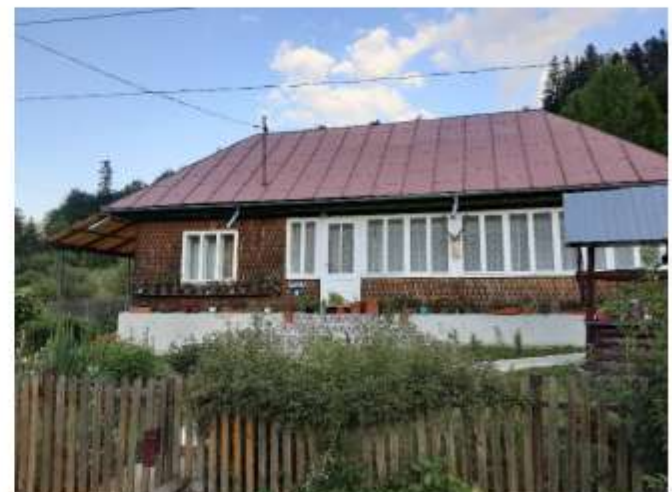
Figura 22 Casa Marica – 4 locuri de cazare