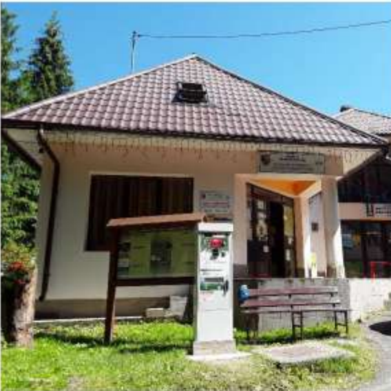
Figura 8 Punct de informare – Direcția de Administrare a Parcului Național