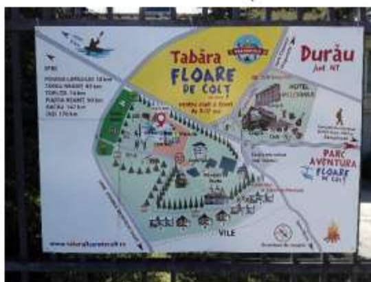
Figura 26 Panou Tabăra Floare de Colț