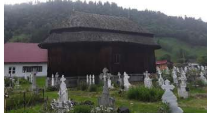
Figura 70, 71 Biserica de lemn "Sf. Voievozi"

În lăcașul din cimitir se slujește de două ori pe lună, cu ocazia marilor sărbători, dar și atunci când se fac pomeniri pentru cei adormiți.