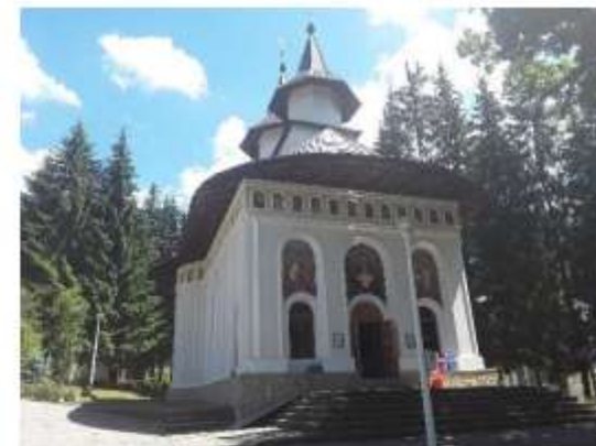
Figura 58 Biserica "Buna Vestire"

Ulterior, a fost înființat aici în 1972 un schit de călugări. Autoritățile comuniste au hotărât construirea stațiunii climaterice Durău în apropierea fostei mănăstiri. Astfel, biserica „Sfânta Sofia” din fostul cimitir al mănăstirii, precum și majoritatea chiliilor monahale din împrejurimi, au fost demolate în anul 1977.