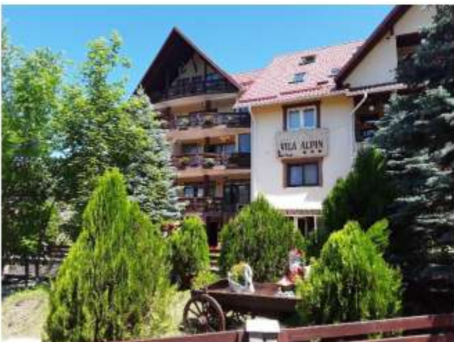
Figura 19 Vila Alpin – 59 locuri de cazare