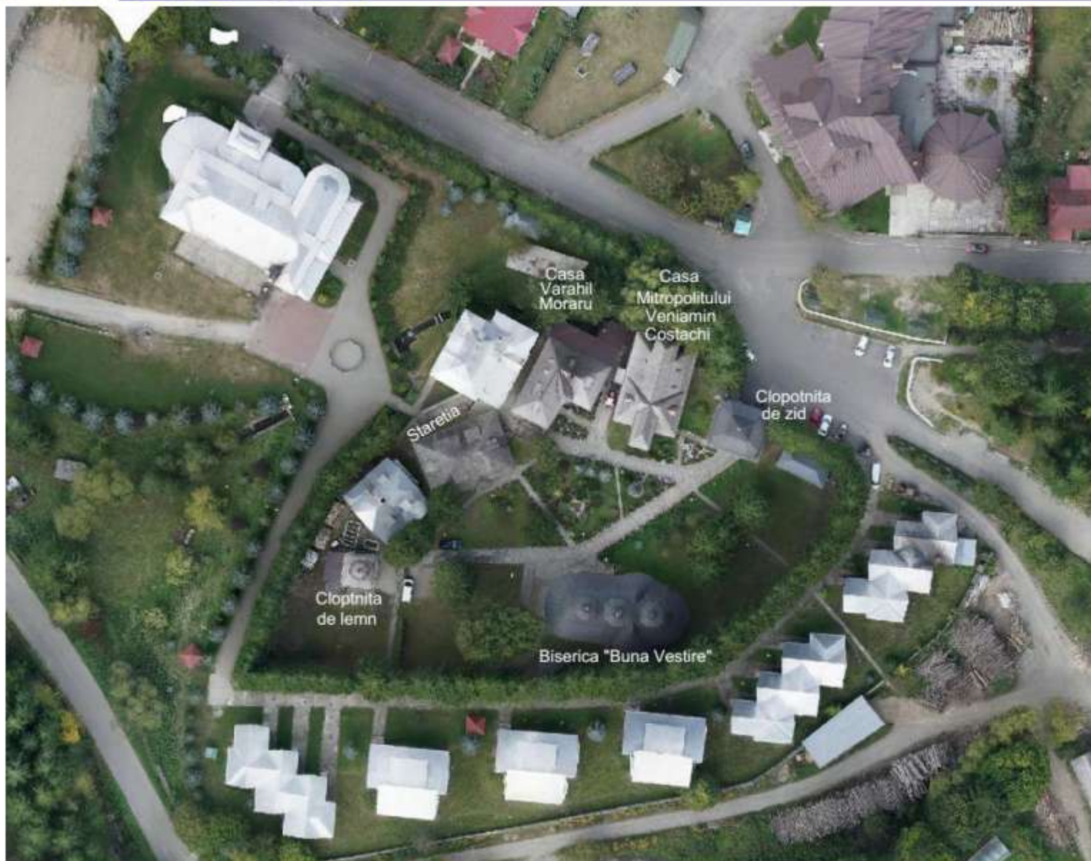
Figura 64 Imagine aeriana Mănăstirea Durău