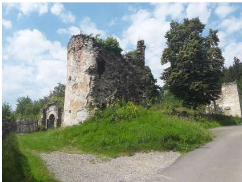
Figura 68 Ruinele Palatului Cnejilor