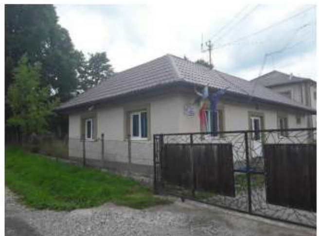
Figura 34 Serviciul de ambulanta Neamt- substatia Ceahlău