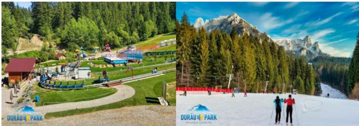
Figura 23 Partia de schi și Parcul de vară Durău

Sectorul de servicii mai beneficiază de existența unei pârtii de schi (parc de distracții în timpul verii), a unui parc de escaladă, a unei tabere pentru copii – Tabăra Floare de colț și a unui club nautic – Club nautic Ceahlău.