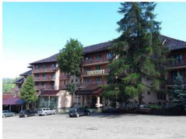
Figura 16 Hotel Bradul – 150 locuri de cazare