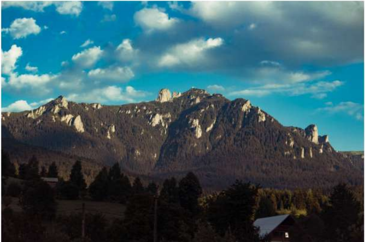
Figura 7 Masivul Ceahlău, vedere din localitatea Ceahlău

Ceahlăul reprezintă cel mai renumit și mai impresionant Masiv din partea centrală a Carpaților Orientali, fiind unul dintre puținele complexe carpatine care mai păstrează încă eșantioane nealterate ale naturii. Este cel mai impunător munte din Carpații Orientali fiind situat în partea centrală a acestora, mai precis la intersecția paralelei de 47° latitudine nordică cu meridianul de 26° longitudine estică.