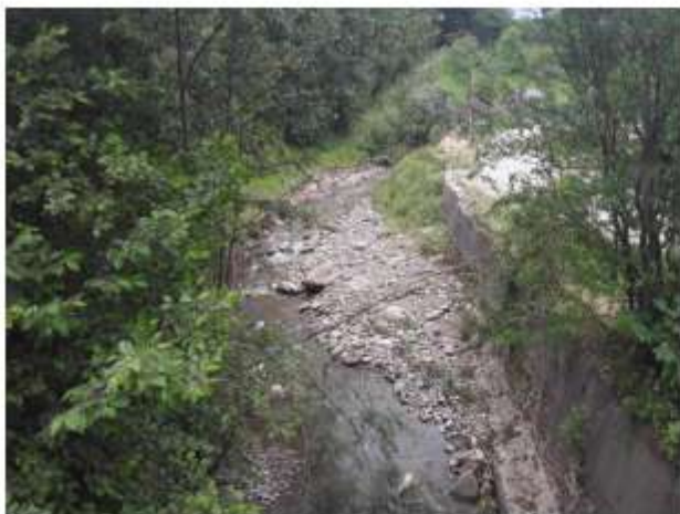
Figura 5 Pârâul Mare