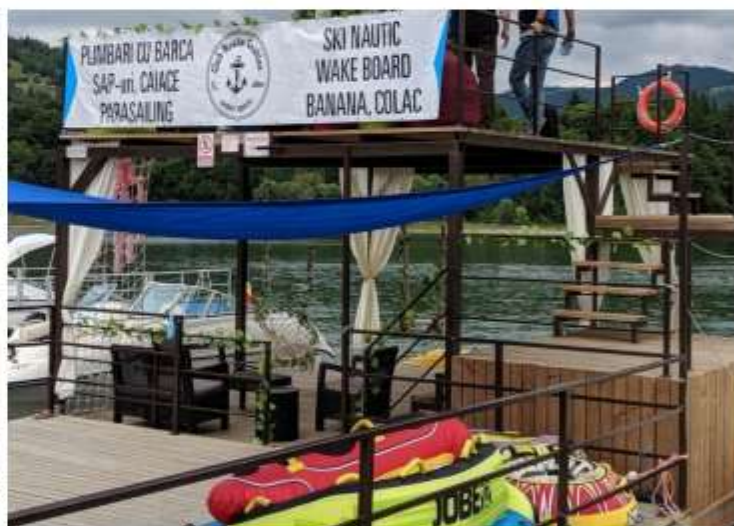
Figura 25 Club Nautic Ceahlău