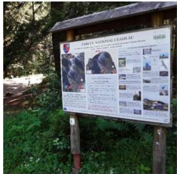
Figura 9 Panou informare PNC

Flora parcului se caracterizează prin 138 specii alge, 1171 specii fungi, 336 specii licheni, 195 specii briofite și 1144 specii de cormofite. Flora vasculară (cormofitele) conține 1144 specii și 62 subspecii (34% din flora României și 68% din flora vasculară a județului Neamț) din care 61 specii protejate, monumente ale naturii, endemite, specii rare, relicve ale erei glaciare. Flora vasculară conține 39 de specii de pteridofite, 8 specii de gimnosperme și 1098 specii de angiosperme.