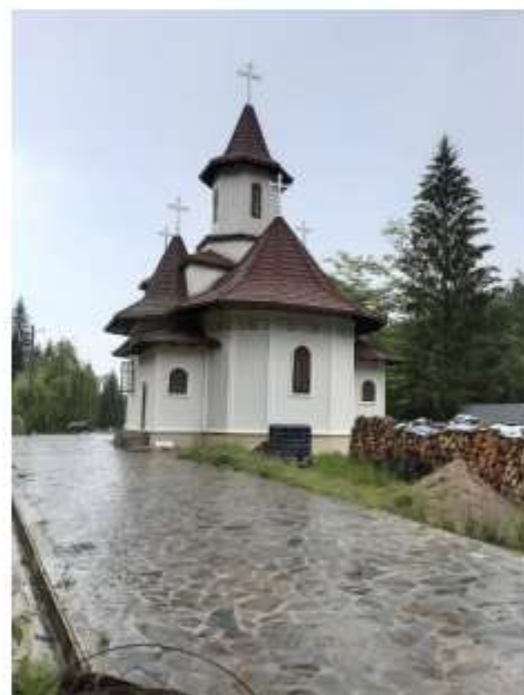
Figura 44 Schitul "Poiana Maicilor"