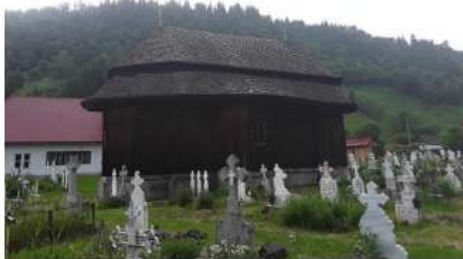
Figura 48 Biserica de lemn “Sfinții Voievozi”