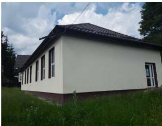
Figura 39 Școala Ceahlău