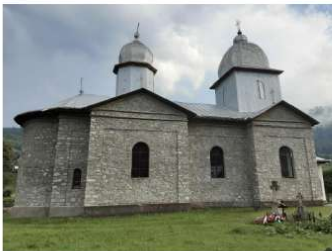
Figura 47 Biserica ortodoxă “Sf. Arh. Mihail și Gavril”