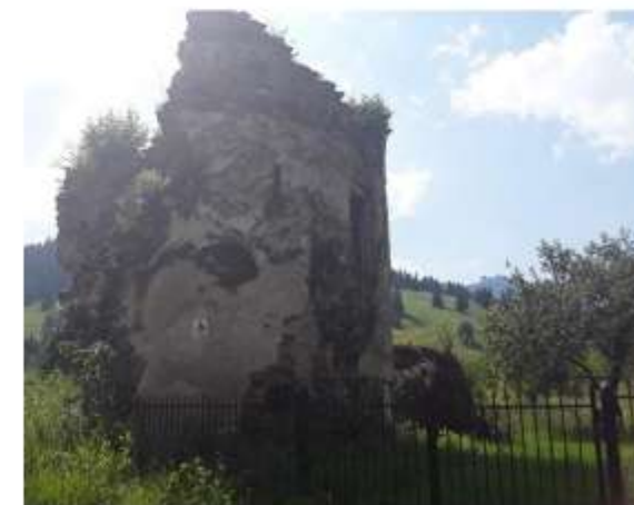
Figura 66 Ruinele Palatului Cnejilor, turnul de nord-est