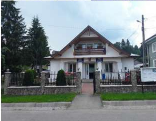
Figura 29 Primăria Ceahlău