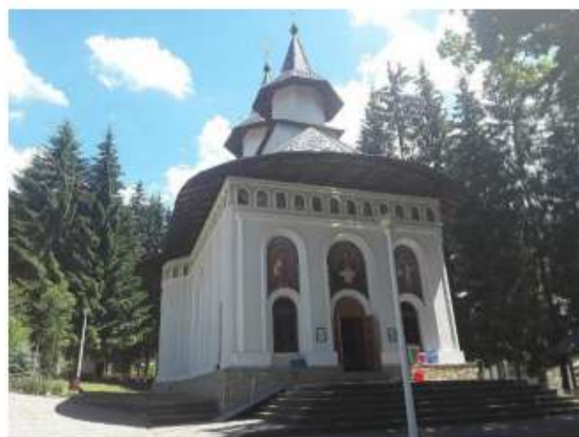
Figura 50 Biserica “Buna Vestire”