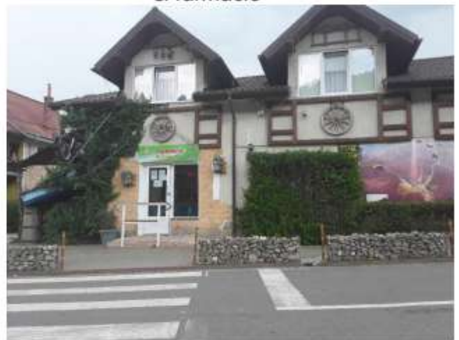
Figura 32 Farmacie