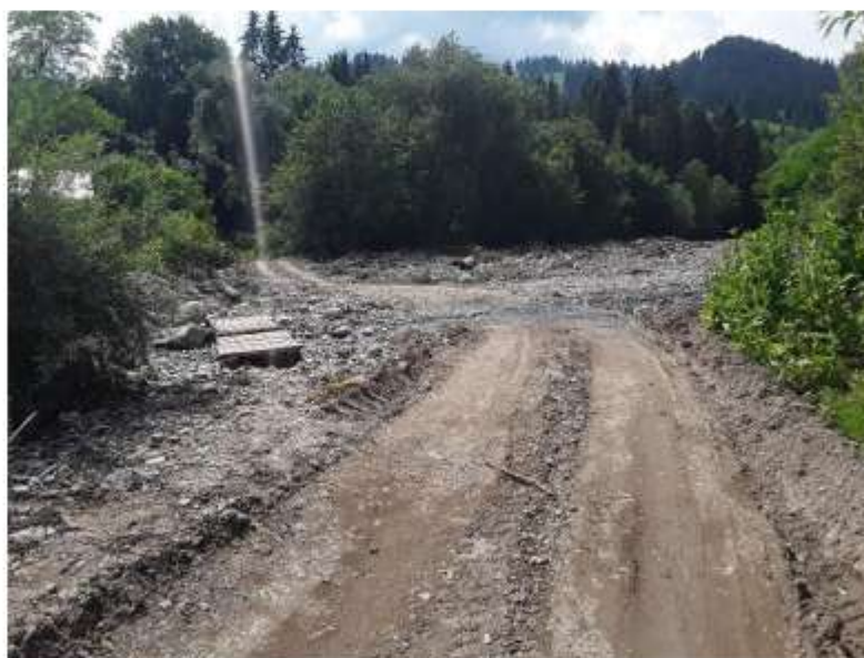
Figura 52 Disfuncționalitate – cale de acces, Pârâul Schit

Podurile sunt insuficiente pentru traversarea cursurilor de apă.