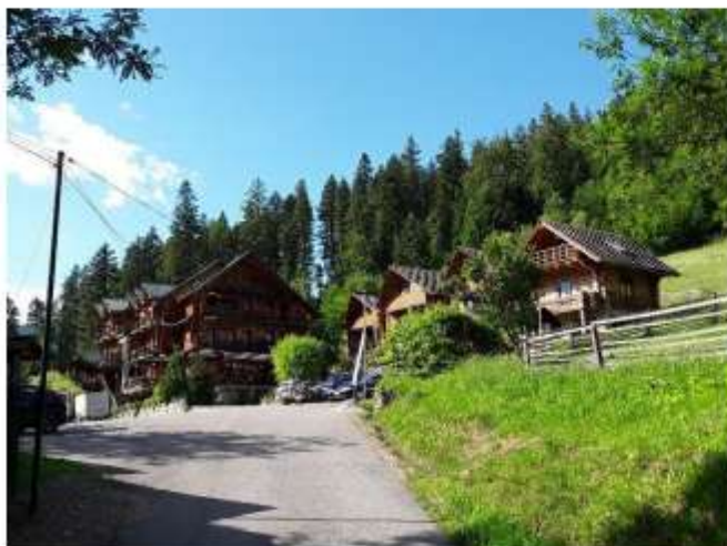
Figura 21 Complex Vânătorul - 50 locuri de cazare