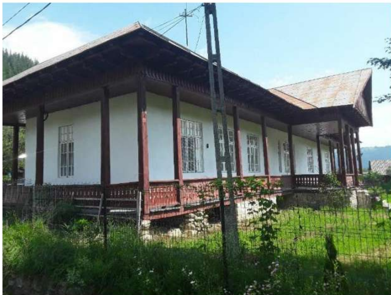
Figura 55 Muzeul Satului din Ceahlău

Obiectivul este reprezentat și delimitat pe planuri – propunere de clasare în LMI.