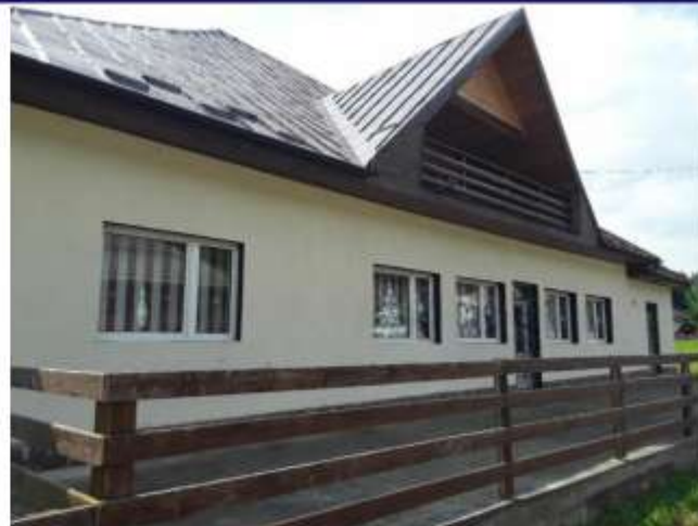
Figura 36 Cămin cultural