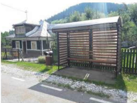
Figura 14 Stație auto Ceahlău