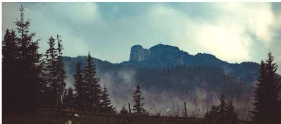
Figura 2 Masivul și PNC Ceahlău – vedere din DJ155F(Axial)

Parcul National Ceahlau a fost constituit in anul 1991, in suprafata totala de 7.742,5 ha. Rezervatia este administrata de Directia de Administrare a Parcului National Ceahlau – judetul Neamt. Intregul ansamblu natural, cu valori exceptional peisagistice, floristice si faunistice (cca. 30% din speciile tarii) a impus mentinerea lui in stare naturala, excluderea oricaror forme de exploatare a resurselor si practicarea unui turism ecologic.