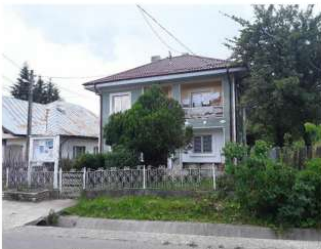
Figura 33 Post Poliție