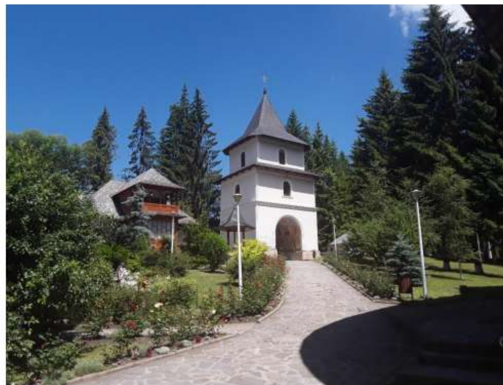
Figura 63 Clopotniță de zid