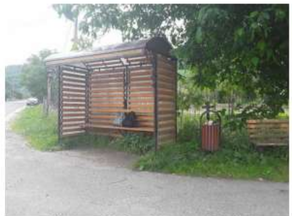
Figura 13 Stație auto, Bistricioara