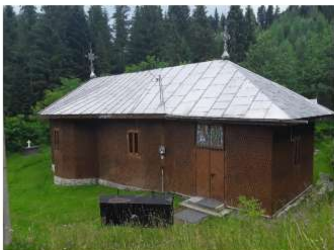
Figura 49 Biserica Biserica „Sfinții Arhangheli”