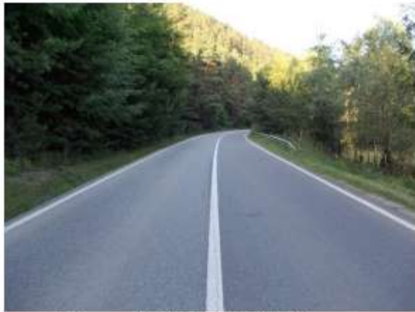
Figura 10 DN 15 Bistricioara