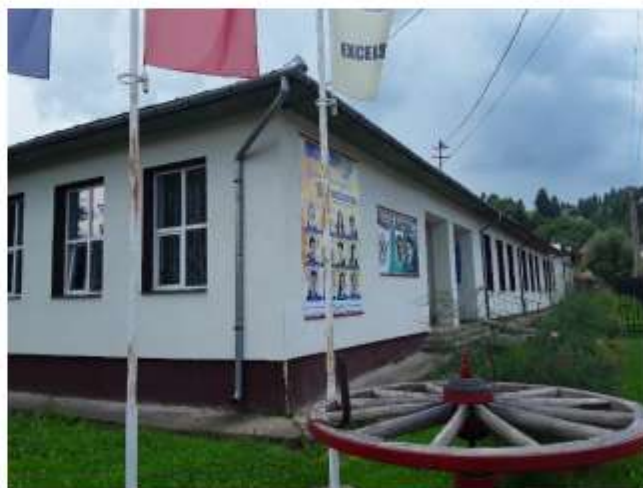
Figura 40 Școala Gimnazială Grigore Ungureanu