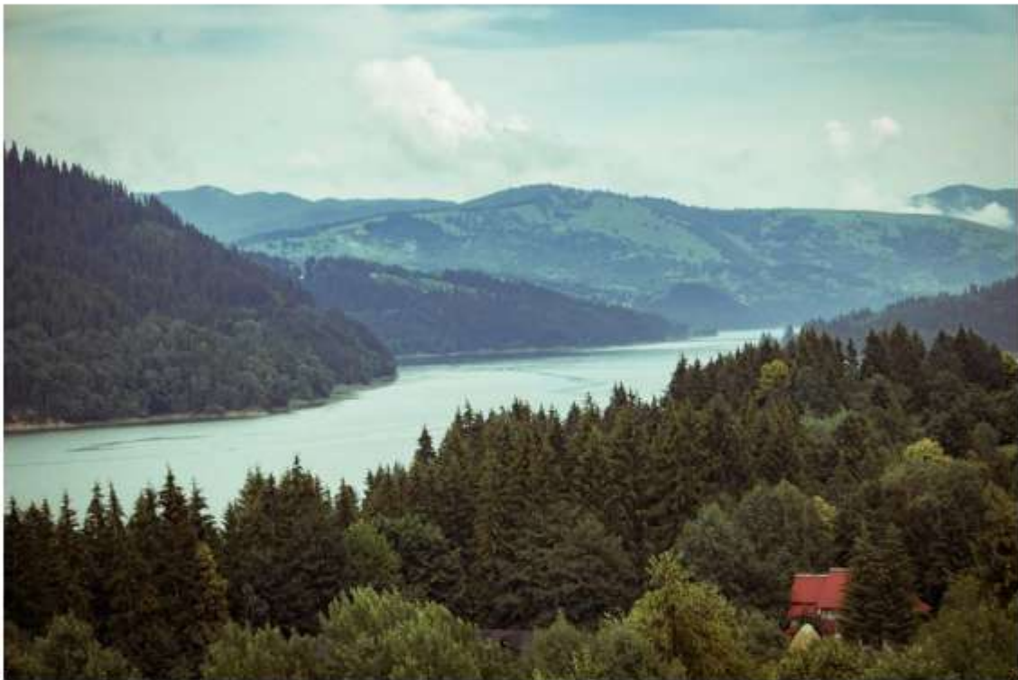
Figura 1 Vedere din Ceahlău spre comuna Hangu