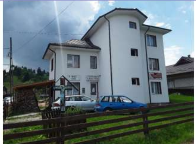
Figura 30 Cabinet medical, stomatologic si farmacie