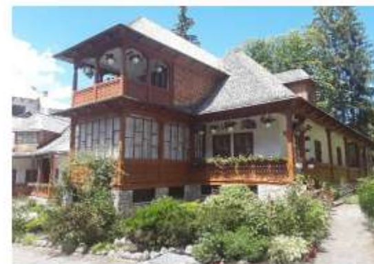
Figura 59 Casa Mitropolitului Veniamin Costachi