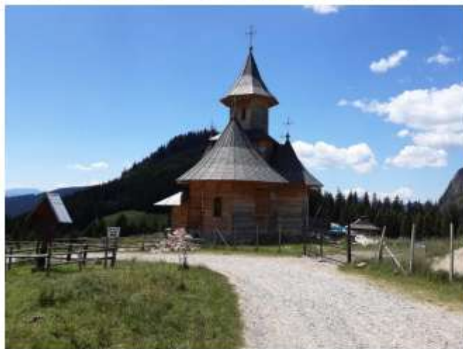
Figura 45 Biserica „Sf. Maria”, Poiana Stănilor