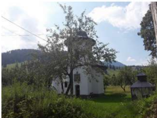
Figura 41 Biserica "Pogorârea Sf. Duh", Palatul Cnejilor