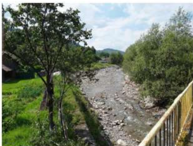
Figura 3 Pârâul Schit

Odată cu darea în funcțiune a barajului de la Bicaz, peisajul natural s-a transformat, iremediabil, prin apariția celui mai mare Lac de acumulare din România, Lacul Izvorul Muntelui, cu o lungime medie de 35 de km, nivelul lui modificându-se în funcție de precipitații și de volumul de apă exploatat pentru producerea energiei electrice. Astfel, ca urmare a barării cursului mijlociu al Bistriței și apariției Lacului de acumulare, o suprafață de aproximativ 500 de ha, în funcție de nivelul de retenție a Lacului, a devenit subacvatică. Astfel s-a creat un ecosistem specific, cu o variație de elemente, atât vegetale, cât și animale.