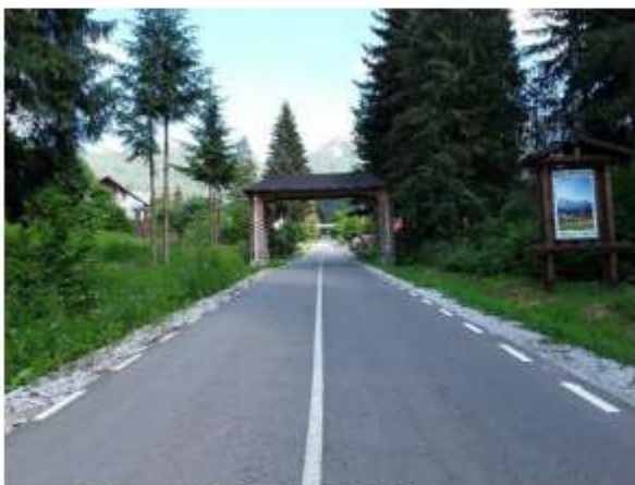
Figura 12 DJ 155 F, Durau