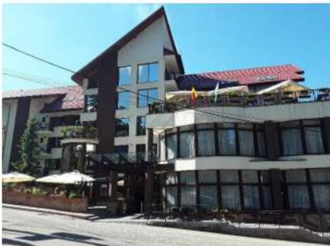
Figura 15 Hotel Bistrița – 92 locuri de cazare