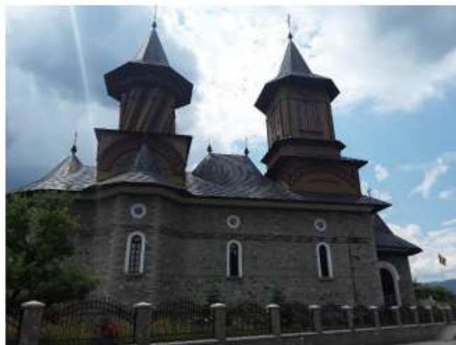
Figura 43 Biserica "Nașterea Maicii Domnului"