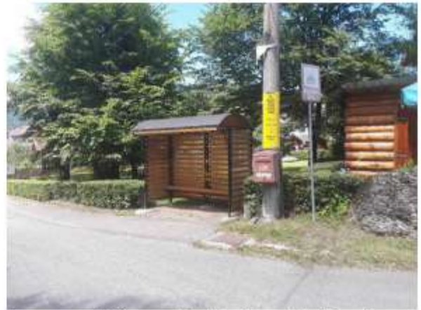
Figura 11 Stație auto, Durău