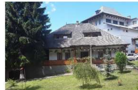
Figura 61 Stăreția

În anul 1991, mitropolitul Daniel Ciobotea a transformat schitul de călugări în mănăstire de maici și a înființat Centrul Cultural-Pastoral „Sf. Daniil Sihastru”, loc de promovare a spiritualității ortodoxe în dialog ecumenic național și internațional. În interiorul Centrului a fost amenajat un paraclis care a fost pictat de arhimandritul Vartolomeu Florea. Centrul Cultural-Pastoral „Sf. Daniil Sihastru” a fost sfințit la 30 octombrie 1995 de către patriarhul Bartolomeu I al Constantinopolului, alături de alți înalți ierarhi, în prezența a numeroși clerici și credincioși.