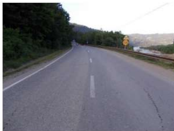
Figura 28 DN 15 Ceahlău

Drumurile comunale sunt pietruite, în general cu balast și de asemenea elementele drumurilor comunale nu sunt executate pe toată lungimea în conformitate cu standardele și normele în vigoare.