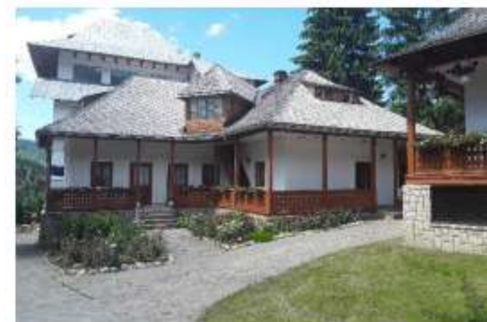
Figura 60 Casa Varahil Moraru