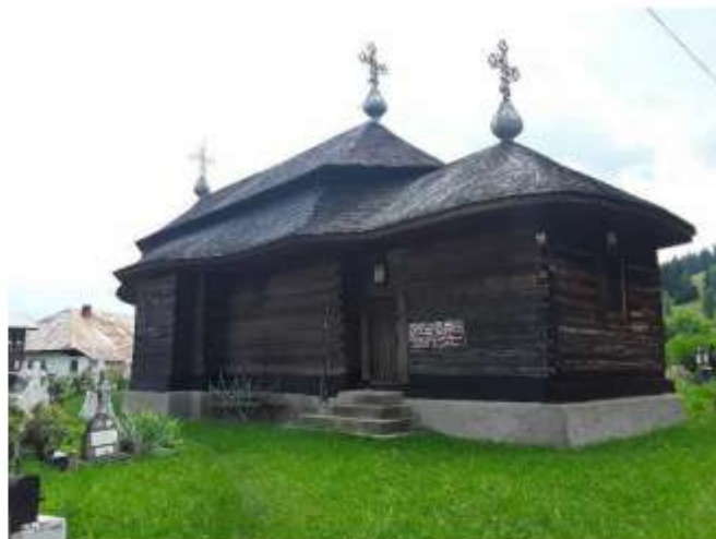
Figura 42 Ansamblul Biserica de lemn „Sf. Ana”