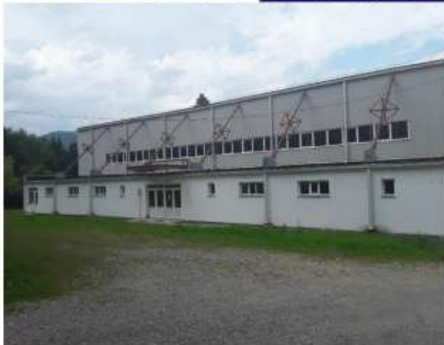
Figura 35 Sală de sport