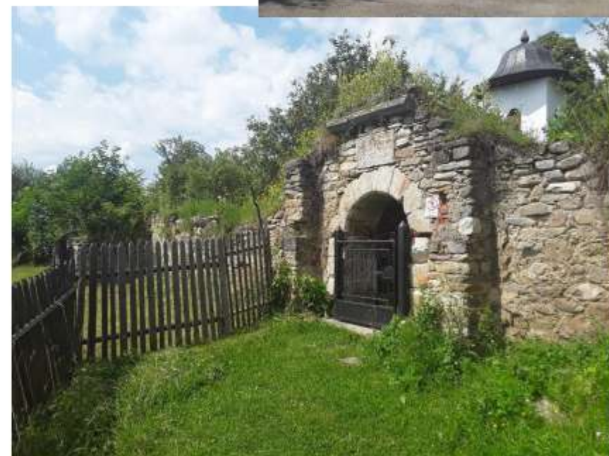
Figura 69 Zid de incintă, intrarea de pe latura de est