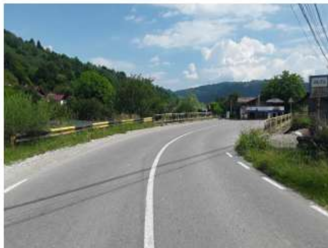
Figura 27 DJ 155F Ceahlău

Dacă drumurile naționale și județene se afla într-o stare bună, fiind în totalitate asfaltate, drumurile comunale se prezintă astfel: 34 km din care 3 km asfaltate și 31 km pietruite.