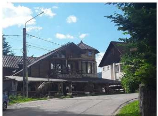
Figura 20 Taverna Ceahlău – 14 locuri de cazare